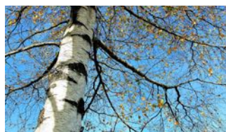
Witte schors aan een berk