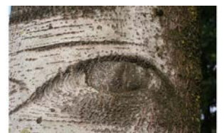
Oog op een grauwe abeel