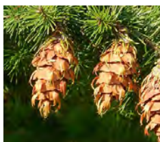
Kegels met 'tongetjes' van een douglasspar