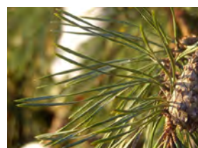
Duo naalden van een den