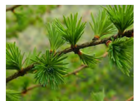
Legio naalden van een lariks