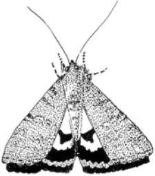
De huismoeder heeft onopvallende voorvleugels en heeft fel gekleurde achtervleugels

Natuurlijk doen vlinders, poppen en rupsen er alles aan om niet door hun vijanden ontdekt en opgegeten te worden. En ze hebben er heel wat trucjes op gevonden.