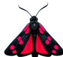
De sint-jansvlinder is een dagactieve nachtvlinder