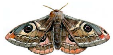
De nachtpauwoog heeft ogen om van te schrikken

De huismoeder (een nachtvlinder) heeft alleen felle kleuren op de ondervleugels. Als ze rust, zie je haar haast niet. Maar als iets of iemand haar stoort, laat ze haar ondervleugels zien. De vijanden schrikken van de felle kleur die opeens tevoorschijn komt! De nachtpauwoog doet ook zoiets. Als hij bijvoorbeeld achtervolgd wordt door een rover, laat hij plotseling zijn oogvlekken zien. Alleen camoufleren of afschrikken werkt natuurlijk niet altijd. Daarom hebben sommige nachtvlinders ook andere trucjes. Er bijvoorbeeld zijn nachtvlinders die heel goed kunnen horen. Als er en dan een vleermuis of vogel aankomt laten ze zich bliksemsnel vallen zodat ze hem kunnen ontwijken.