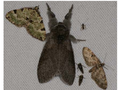
Nachtvlinders op een laken

Wil je een keer nachtvlinders zien, dan kun je ze na zonsondergang proberen te lokken. Dan kan je ze goed bekijken en misschien wel een paar bijzondere soorten zien!