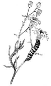
De rups van de sint-jacobsvlinder is giftig. Dat laat hij zien door zijn felle geel met zwarte strepen.

blad. Dan vallen ze minder op. Ook de pop is onopvallend gekleurd zodat je hem moeilijk kunt vinden. Sommige nachtvinderrupsen maken een cocon voordat ze zich verpoppen. Een cocon is een soort 'jasje' voor de pop, die de rups maakt door draden aan elkaar te spinnen. Op die manier zijn ze nog beter verborgen voor vijanden en minder smakelijk. Ook de rupsen zijn vaak erg onopvallend. Sommige rupsen lijken op takjes of blaadjes of ze hebben dezelfde kleur als de plant waar ze op zitten. Daardoor zien vijanden ze niet. Lijken op iets wat je eigenlijk niet bent heet mimicry (dat spreek je uit als mie-mie-krie).