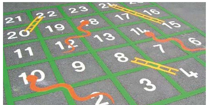
Voorbeeld spel snakes and ladders.

In de natuur is veel te tellen, bijvoorbeeld poten: Een spin heeft altijd 8 poten, insecten hebben 6 poten, konijnen 4 poten, vogels 2 poten. Slangen hebben geen poten. Rupsen lijken 16 poten te hebben, een rups heeft echter maar 6 echte poten, de overige 10 (propoten) kan hij intrekken. Een jonge duizendpoot heeft 14 poten. De volwassen duizendpooten die je in Nederland in je achtertuin kunt vinden hebben zo'n 30 tot 42 poten. Dat is heel veel, maar geen duizend.